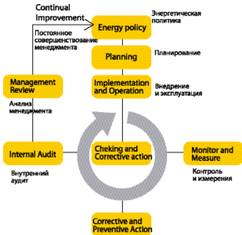
Рис. 1. Модель системы энергоменеджмента

(27.05.2009 г.). Представитель РГ вошел в состав нового национального ТК «Энергосбережение, энергетическая эффективность, энергоменеджмент», ведение секретариата которого поручено ФГУП «ВНИИНМАШ».